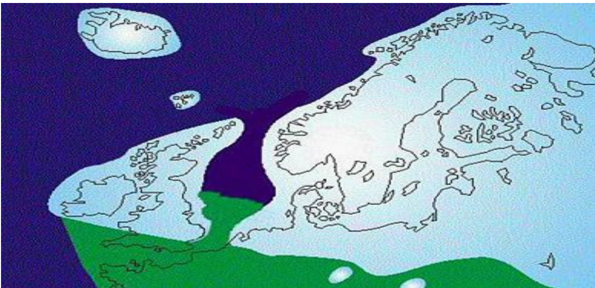
Saale ijskap over Europa

Na de Elster-ijstijd en het Holstein interglaciaal kwam het geweld van de Saale-ijstijd. Een honderden meters dikke laag ijs walste over het land. We hebben aan de beweging van het Saale ijs, zo'n 150 duizend jaar geleden, de stuwwallen in Nederland (Veluwe, Utrechtse Heuvelrug) en ook de Hondsrug te danken, evenals de Rolderrug waar Vries en Donderen op liggen. Tussen de ruggen ontstonden beekdalen, zoals dat van de Grote Masloot en de Drentsche Aa