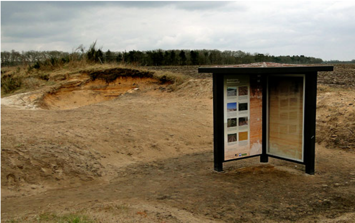
Aardkundig monument bij Vries