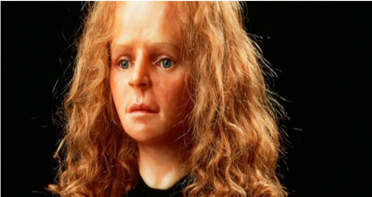
Reconstructie van het Meisje van Yde