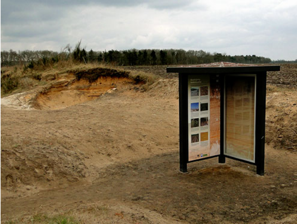
Aardkundig monument bij Vries

Geologen hebben uitgeplozen dat Noord-Nederland in de Elster-ijstijd voor het eerst door schuivend landijs werd bedekt. Het moet zo'n 475 duizend jaar geleden zijn. Dit is te zien in het Aardkundig Monument, een twee meter hoge zandafgraving. Het bodemprofiel hier laat zien wat de laatste drie ijstijden met onze bodem hebben gedaan. Het smeltwater van de Elster-ijstijd voerde de onderste laag spierwit zand aan, te zien onder in het aardkundig monument.