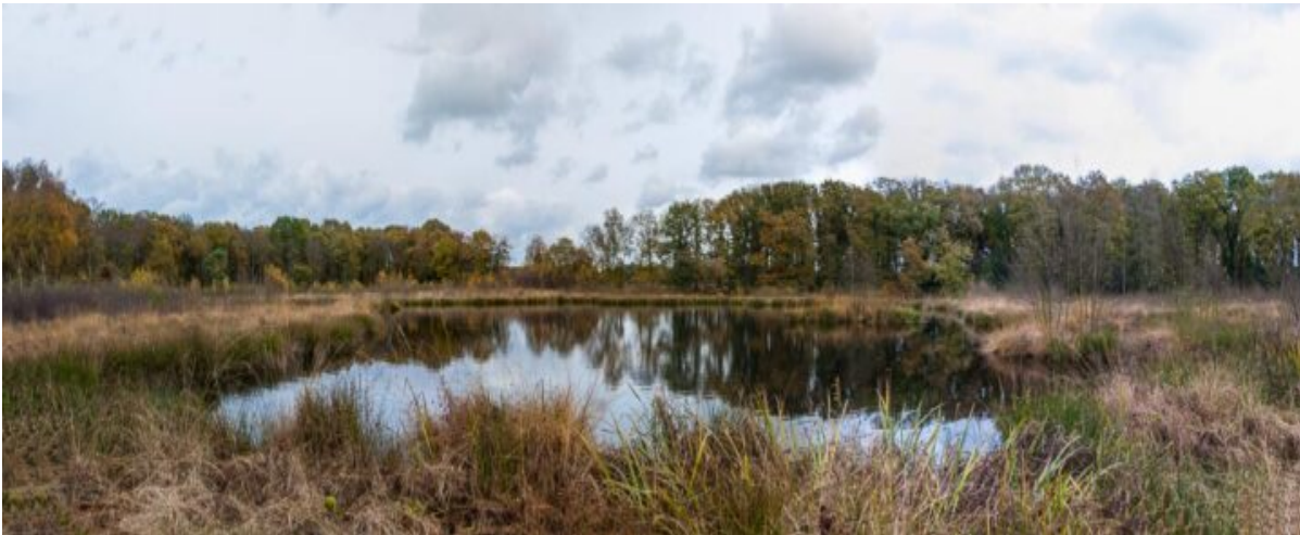
Panorama van het Holtveen, een pingoruÃne

Door spleten in de bevroren grond kwam in de Weichsel-ijstijd grondwater naar boven dat meteen bevroor. Maar het water bleef komen en groeide uit tot een tientallen meters hoge ijsheuvel, ofwel een pingo. Na het smelten van het ijs bleef een diepe kuil achter waar water in bleef staan. We noemen ze pingoruÃnes . Later groeiden ze vol met veen. De wandeling komt langs de pingoruÃnes het Holtveen en het Ronde Veen.