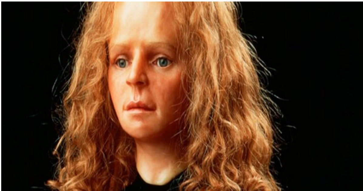
Reconstructie van het Meisje van Yde