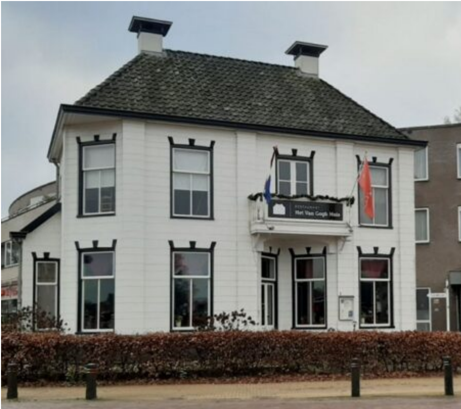
Das Van-Gogh-Haus in Veenoord

Das Van-Gogh-Haus ist das einzige öffentlich zugängliche Haus in den Niederlanden, in dem van Gogh wohnte und arbeitete. Besucher des Hauses erhalten eine persönliche Führung und können sich das Ess- und das Schlafzimmer anschauen. Außerdem wird ein interessanter Film gezeigt. Im Museumsshop sind tolle Geschenke erhältlich und im Empfangsraum befindet sich die Eingangspforte zu den „Künstlern auf dem Hondsrug“. Die Themen der neun Hotspots dieser Expedition werden hier erläutert, um die Besucher auf diese Hotspots neugierig zu machen.