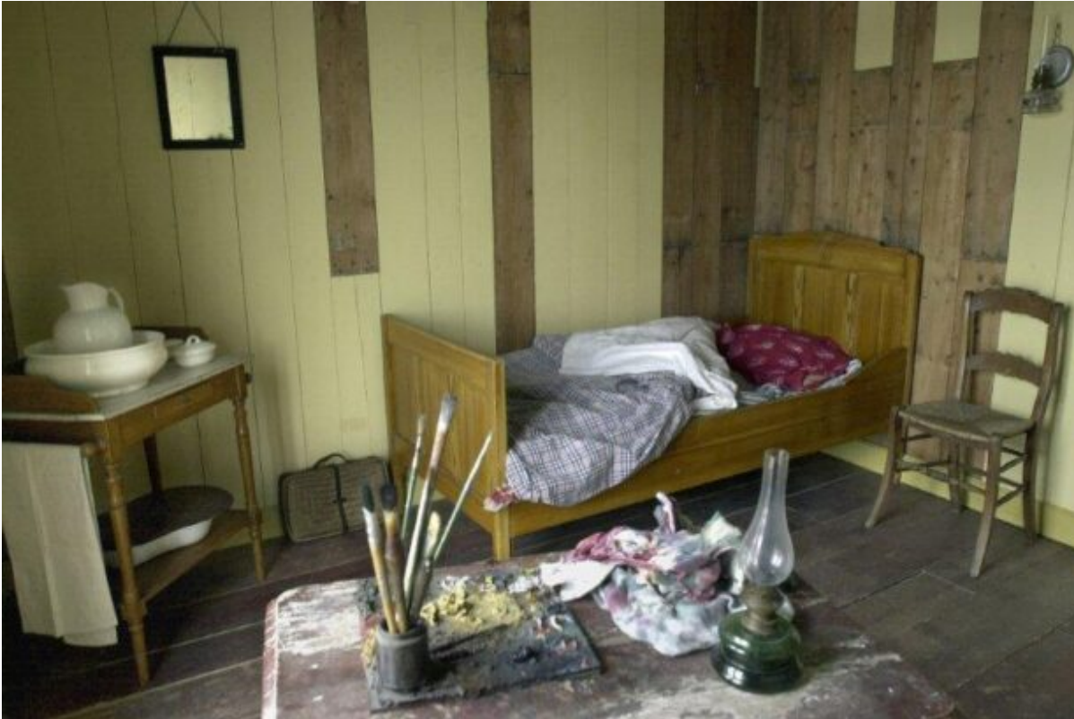
Van Goghs Schlaf- und Arbeitszimmer in der Herberge