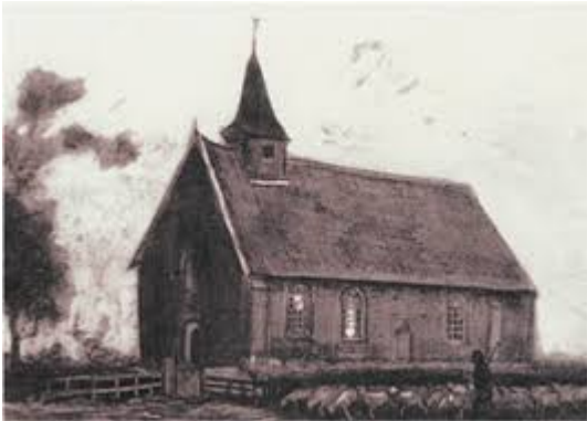
Die Kirche Zweeloo, durch die Augen von Vincent van Gogh