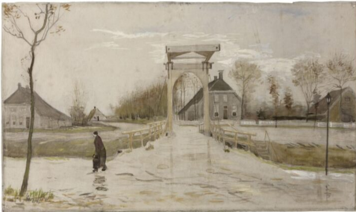
Die Brücke in Nieuw-Amsterdam, gemalt von Vincent van Gogh