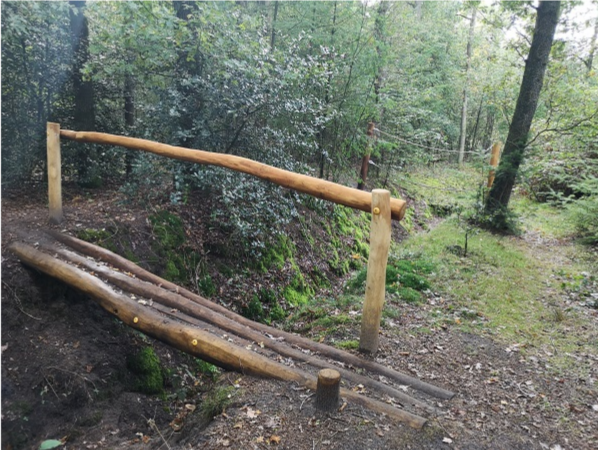
Een van de speeltoestellen langs het Sabeltandtijgerspoor.