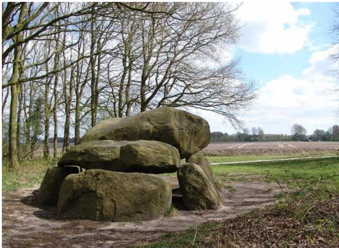
Das Großsteingrab G1 in Noordlaren

Eine weitere Quelle ist ein Artikel von Jetzo Boeles im Groninger Volksalmanach, aus dem Jahr 1845. Er beschreibt darin, wie ein alter Bewohner einst seinem Vater von einer Ausgrabung an dem Großsteingrab erzählte, bei der – wahrscheinlich um 1750 – Knochen, Urnen mit Asche und ein bearbeiteter schwarzer Steinhammer gefunden wurden. Die Löcher oben in den Steinen hinten links und vorn rechts zeugen von dem Versuch ungefähr im Jahr 1800, das Hünengrab zu sprengen. Die Täter wollten die Steinstücke als Rohstoff verkaufen. Zum Glück wurden sie ertappt, und der Abriss des verbliebenen Großsteingrabs konnte gerade so verhindert werden. Heute stehen Großsteingräber unter Denkmalschutz.