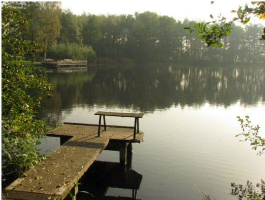
Ein Paradies für Angler