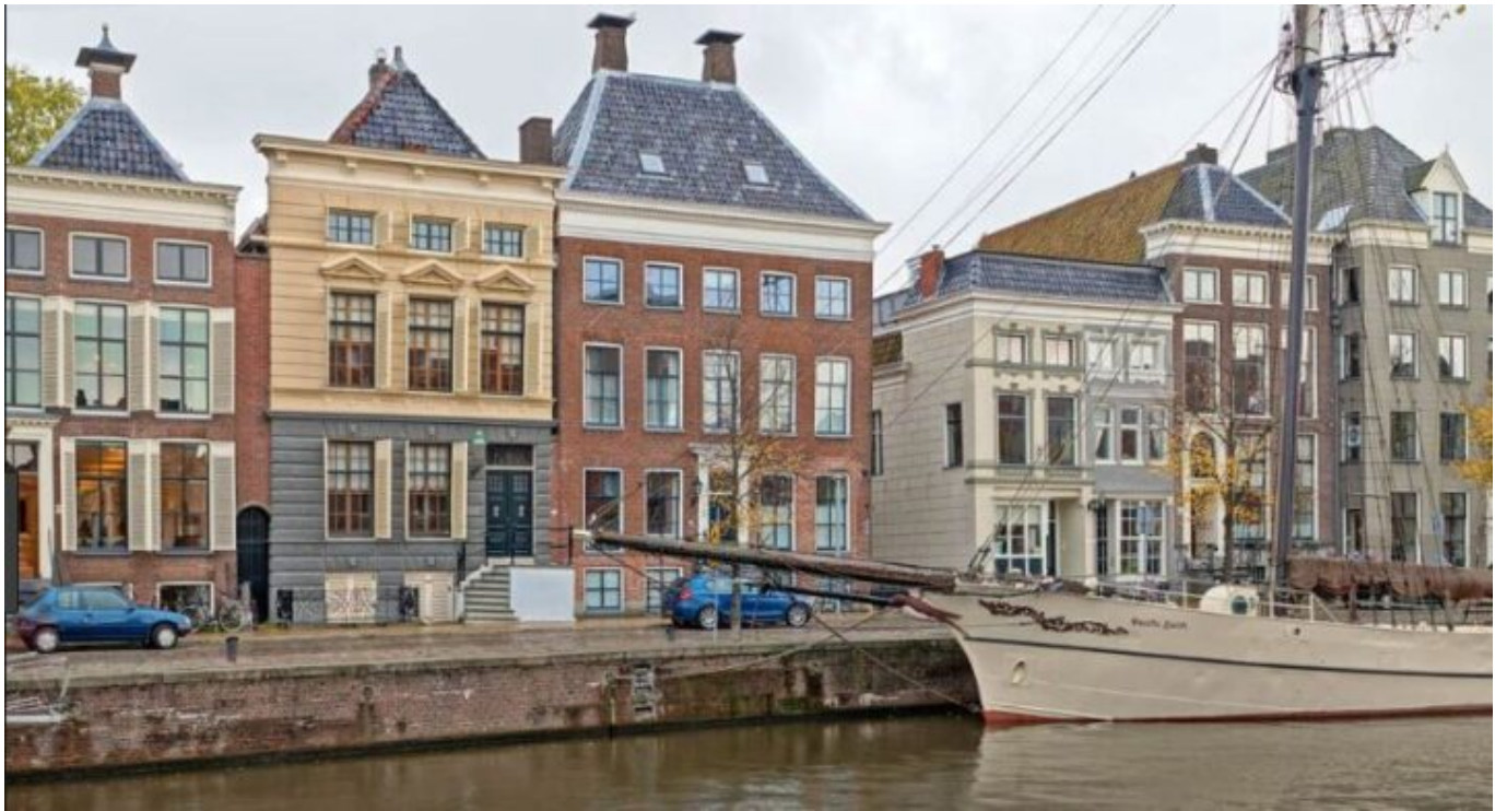
Patrizierhäuser an der Hoge der A