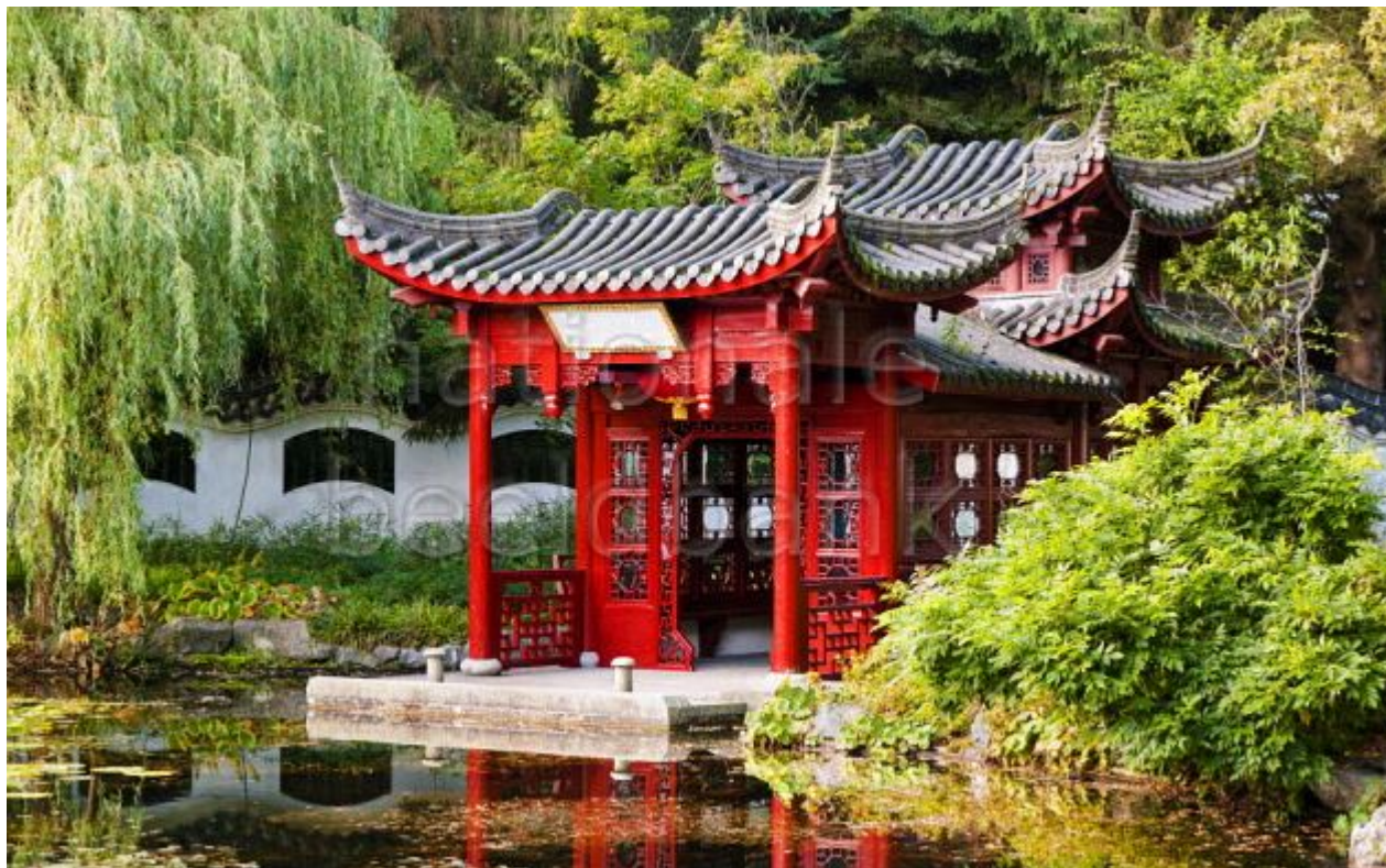
Der chinesische Pavillon