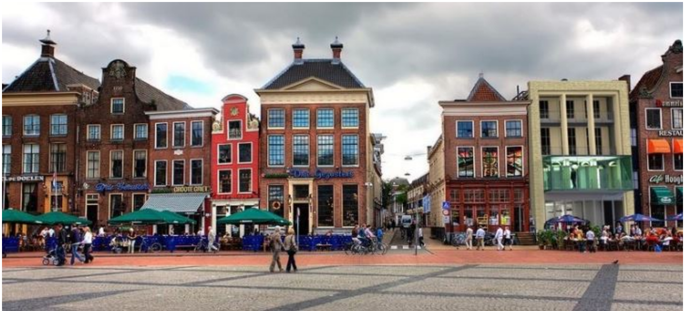
Der Große Markt in Groningen mit den „Drie Gezusters“