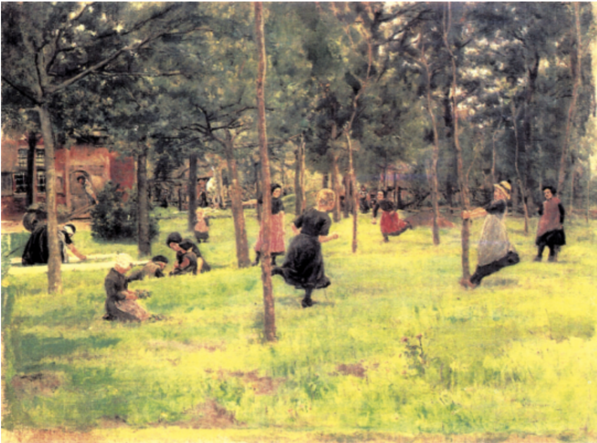
Boompje wisselen van Max Liebermann