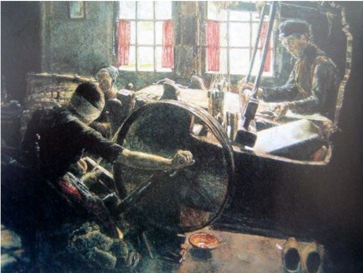
De Wever van Max Liebermann

Het dorp Zweeloo is goed bereikbaar vanuit alle windrichtingen en ook met het openbaar vervoer. Op hub Zweeloo arriveren en vertrekken minimaal 1x per uur bussen vanuit en naar Assen/Beilen, Emmen en Hoogeveen. Vanuit hub Zweeloo is het slechts 2 minuten lopen naar het startpunt.