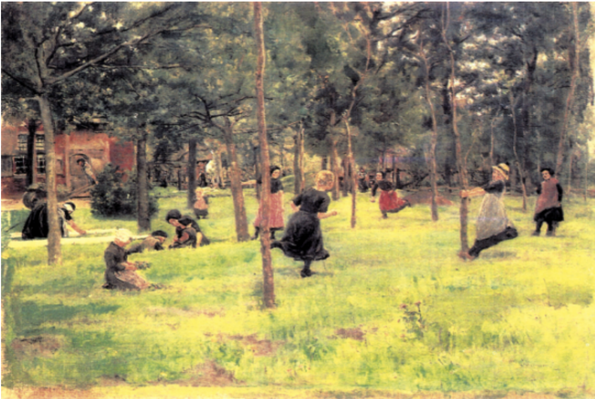
Boompje wisselen van Max Liebermann