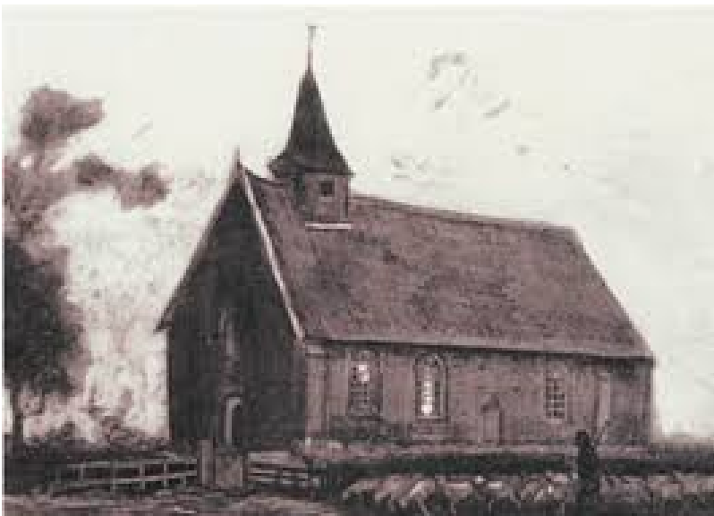
Het kerkje van Zweeloo, vereeuwigd door Vincent van Gogh