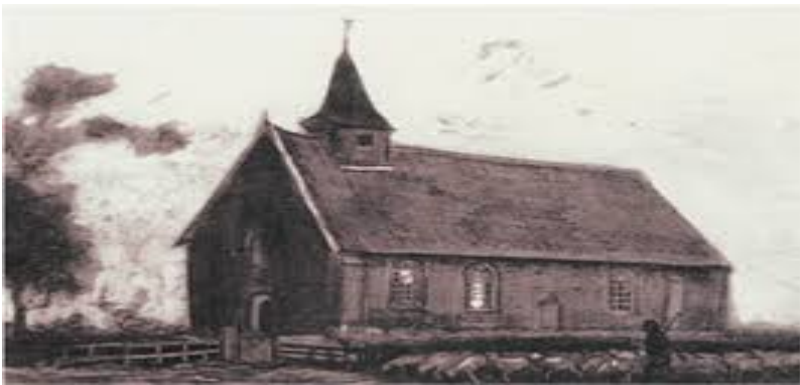
Het kerkje van Zweeloo, vereeuwigd door Vincent van Gogh