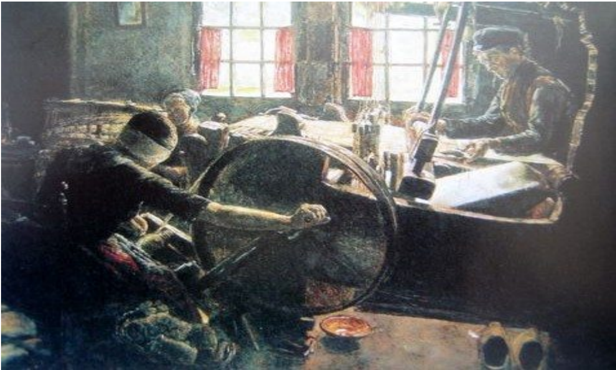
De Wever van Max Liebermann