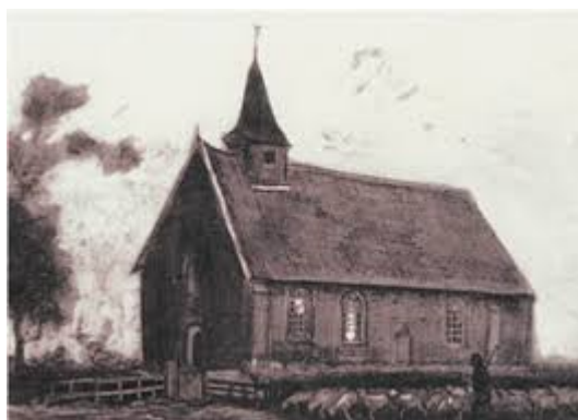
Het kerkje van Zweeloo, vereeuwigd door Vincent van Gogh