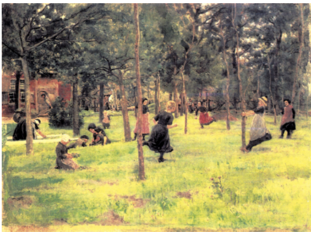
Boompje wisselen van Max Liebermann