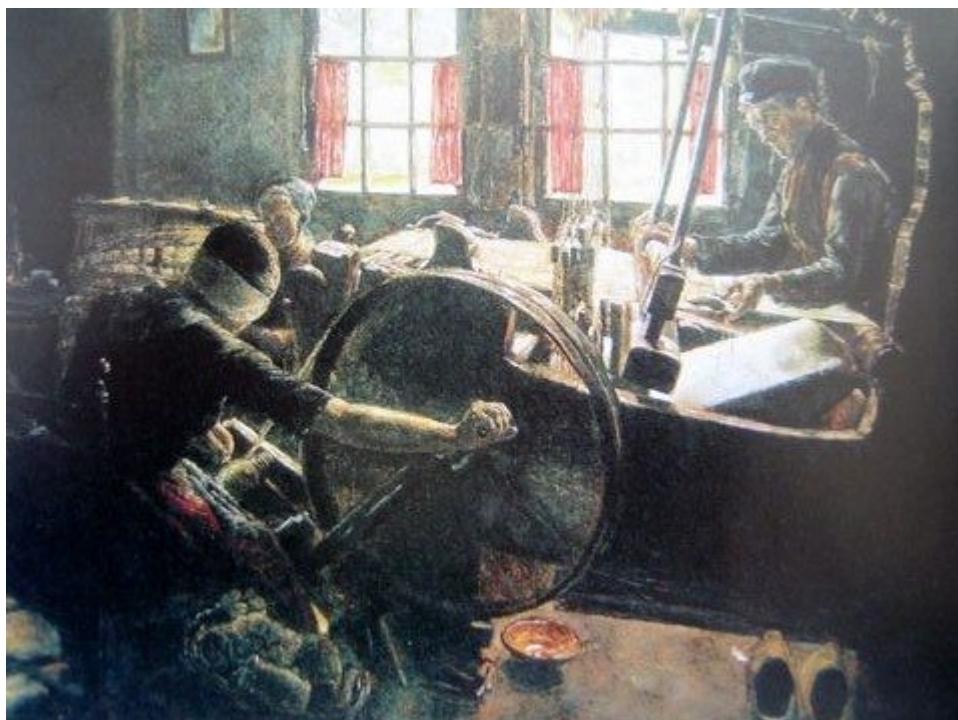
De Wever van Max Liebermann