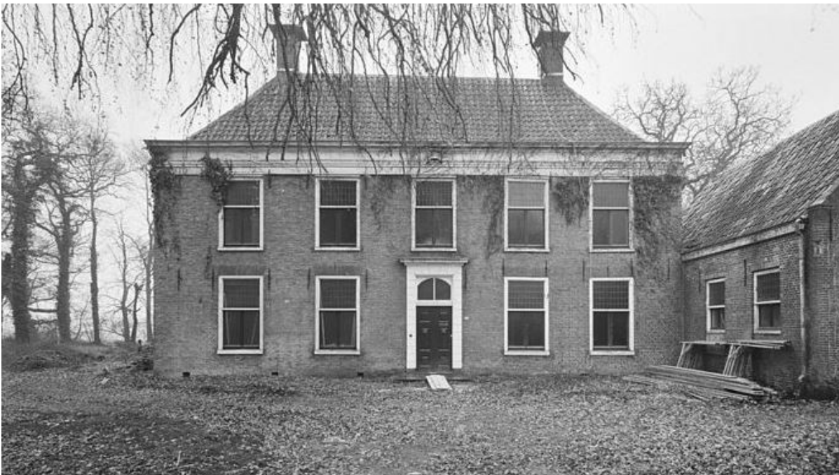
Huis te Glimmen op een oude foto

Glimmen ligt in het landgoederenlandschap op de grens met het stroomdallandschap van de Drentsche Aa. Het 'Nationaal beek- en esdorpenlandschap Drentsche Aa' is in West-Europa het best bewaarde in zijn soort. Middenin dit landschap staat het Huis te Glimmen; een buitenhuis met een rijke historie. Tot aan het eind van de 19e eeuw was het landgoed in bezit van de familie Quintus naar wie het Quintusbos is genoemd. In dit bos ligt ook een voormalige eendenkooi. Onlangs is de eendenkooi opgeknapt. De eendenkooi heeft zijn oorspronkelijke functie niet teruggekregen. Met het herstel zijn de kenmerken versterkt en daarmee is de kooi goed te herkennen.