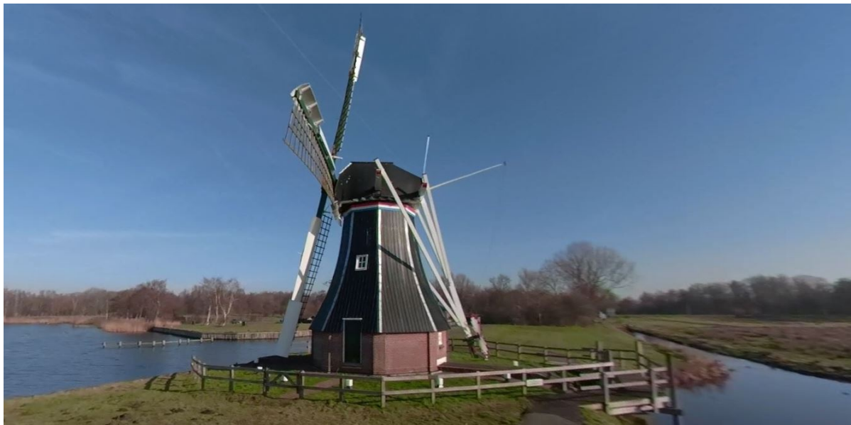
Poldermolen de Helper

paviljoen, het Familiehôtel en het clubhuis van zeilvereniging De Twee Provinciën. Ook de sluis Nijveensterkolk en poldermolen De Helper zijn bijzondere elementen in het landschap.