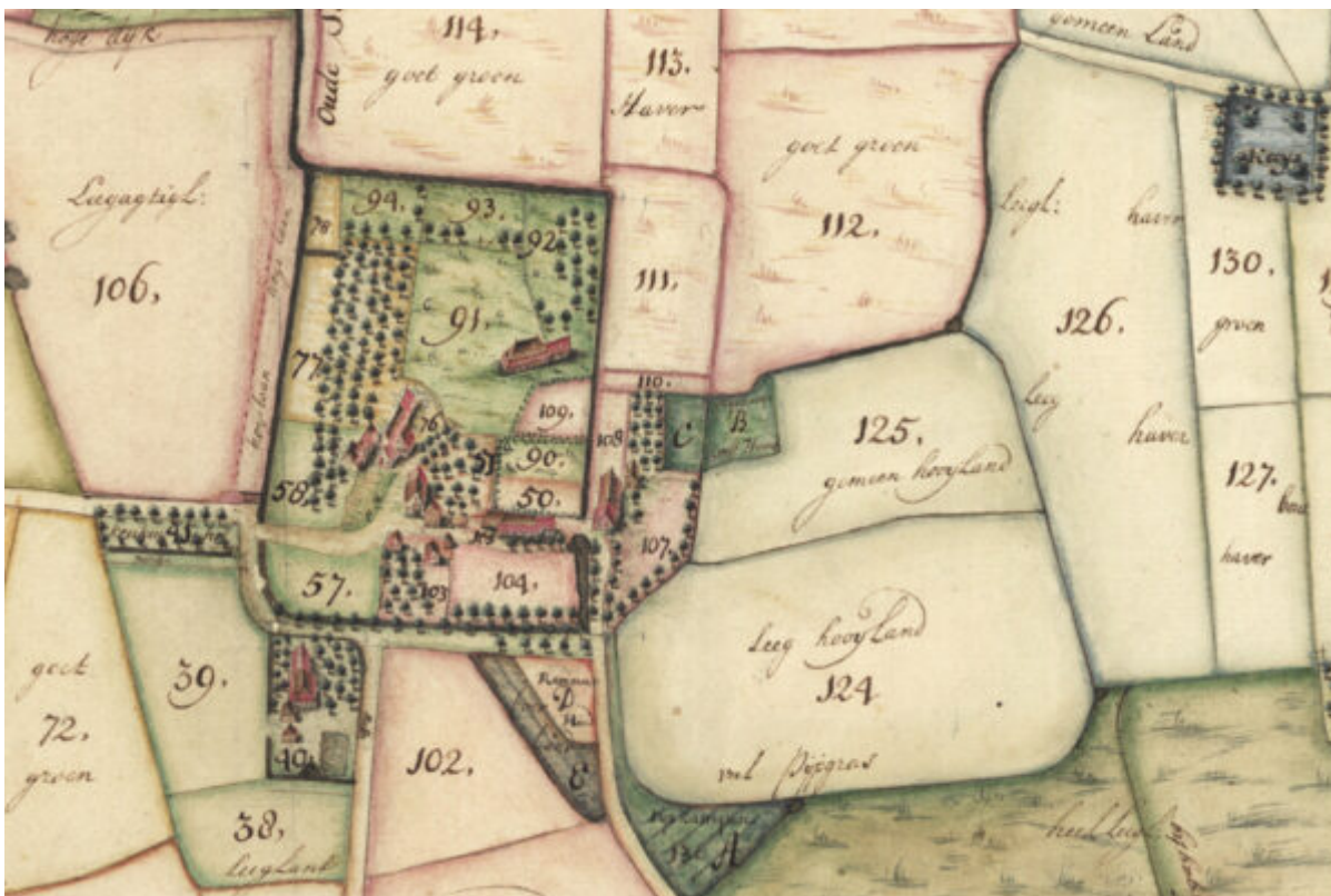
Een historische kaart van Klooster Yesse toont het vroegere landschap

De buurtschap Essen ligt op het noordelijk deel van de Hondsrug, op de overgang naar het natte veen. Tot in de jaren zestig was het een traditioneel landbouwgebied. De oude zandwegen, houtwallen en boerderijen herinneren nog aan die tijd. In dit gebied vormt de Rijksstraatweg, met haar statige landhuizen een uniek beeld. Een ander bijzonder element in het landschap is het voormalige kloostercomplex Yesse in de buurtschap Essen.