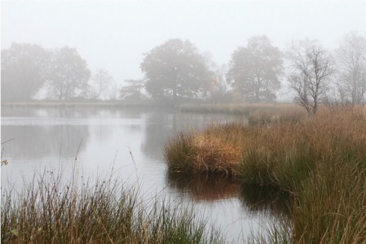
Der Kampheider See