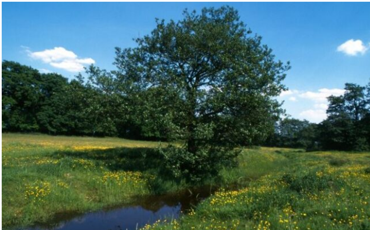
De Runsloot kronkelt door het dalletje