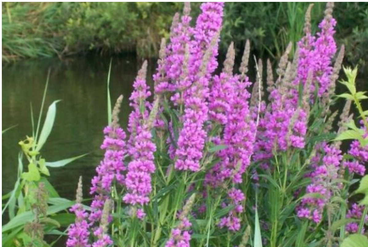
Kattestaart in de Hondstong

De route door de Hondstong is uitgezet met paaltjes met een paarse kop. Wist je overigens dat de Hondstong een oude bloemennaam is? Vroeger noemde men in deze streken de paardenbloem zo. De route door de Hondstong is uitgezet met paaltjes met een paarse kop. Honden zijn aangelijnd toegestaan. De begaanbaarheid van de paden is goed, in natte jaargetijden aan het begin van de route even goed uitkijken en laarzen dragen.