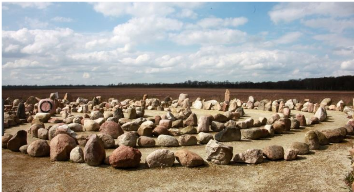
Monument en kunstwerk Gebroken Cirkel

Onderweg zie je met eigen ogen hoe Stichting Het Drentse Landschap haar best doet voor de natuur en voor het Drentse cultureel erfgoed. Natuur en erfgoed zijn ook úw aandacht meer dan waard! Steun ons... Dat kan op verschillende manieren. Kijk voor meer informatie op www.drentslandschap.nl .