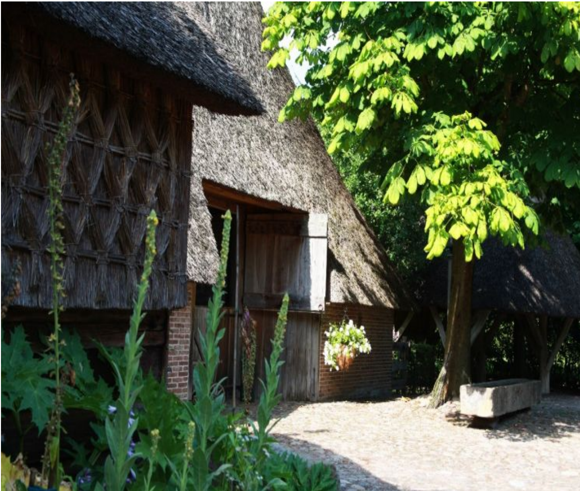
Monumentale boerderij in Oud-Aalden