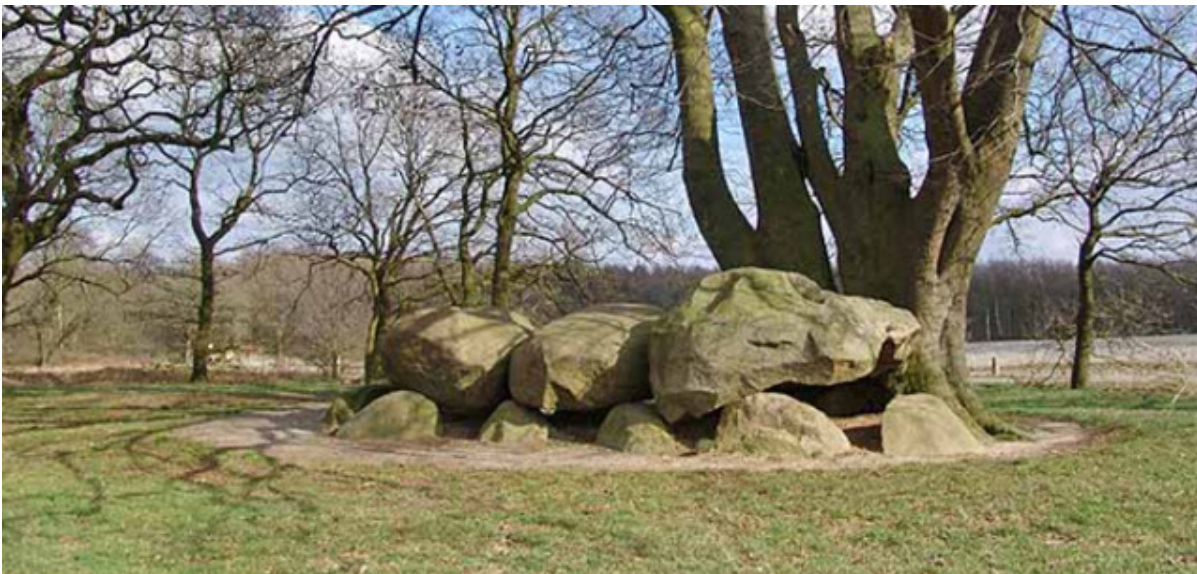
Een van de hunebedden bij Bronneger

Deze naam danken ze aan het vervaardigen en gebruiken van trechtervormige potten. Het grootste hunebed van Nederland is 22,5 meter lang.