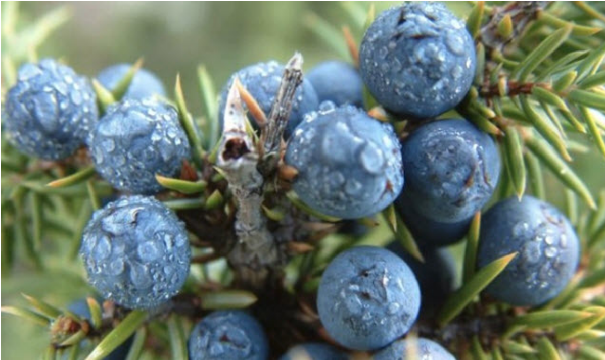
Jeneverbes op het Drouwenerzand