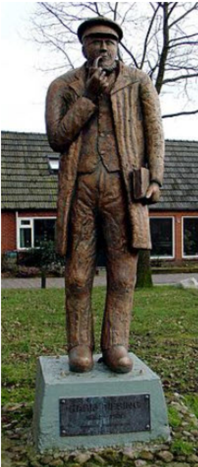
Beeld Harm Tiesing

De Drentse schrijver Harm Tiesing leefde van 1853 tot 1936. Zijn meer dan 100 titels omvattende oeuvre handelde over uiteenlopende onderwerpen uit het dagelijks leven. In het politieke en sociale leven van Borger nam hij een voorname plaats in.