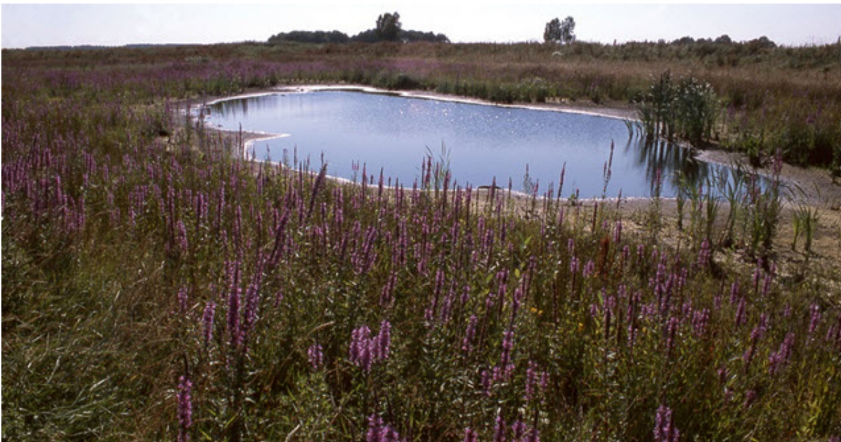
Dal van de Hunze

Hier heb je een prachtig uitzicht op het stroomdal van de Hunze. De oude rivier de Hunze vormt de oostgrens van de Hondsrug. Het hoogteverschil is op sommige plaatsen meer dan 20 meter.