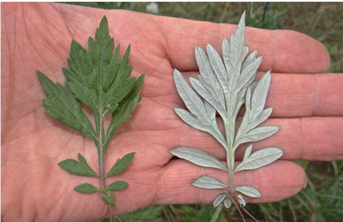
Bijvoet of Artemisia

Bijvoet is een algemeen voorkomende, zomerbloeiende plant. De Nederlandse naam doet denken aan een Romeins gebruik. De Romeinen deden stukken van de plant in hun sandalen omdat ze dan minder last hadden van vermoeide voeten. De bladeren bevatten een vluchtige olie die in aanraking met warme voeten verdampt, hetgeen een verkoelend effect heeft.