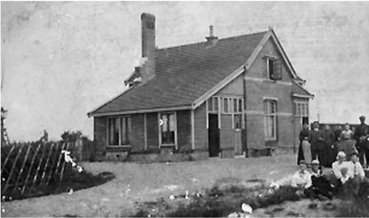
Halte Drouwen (1905)