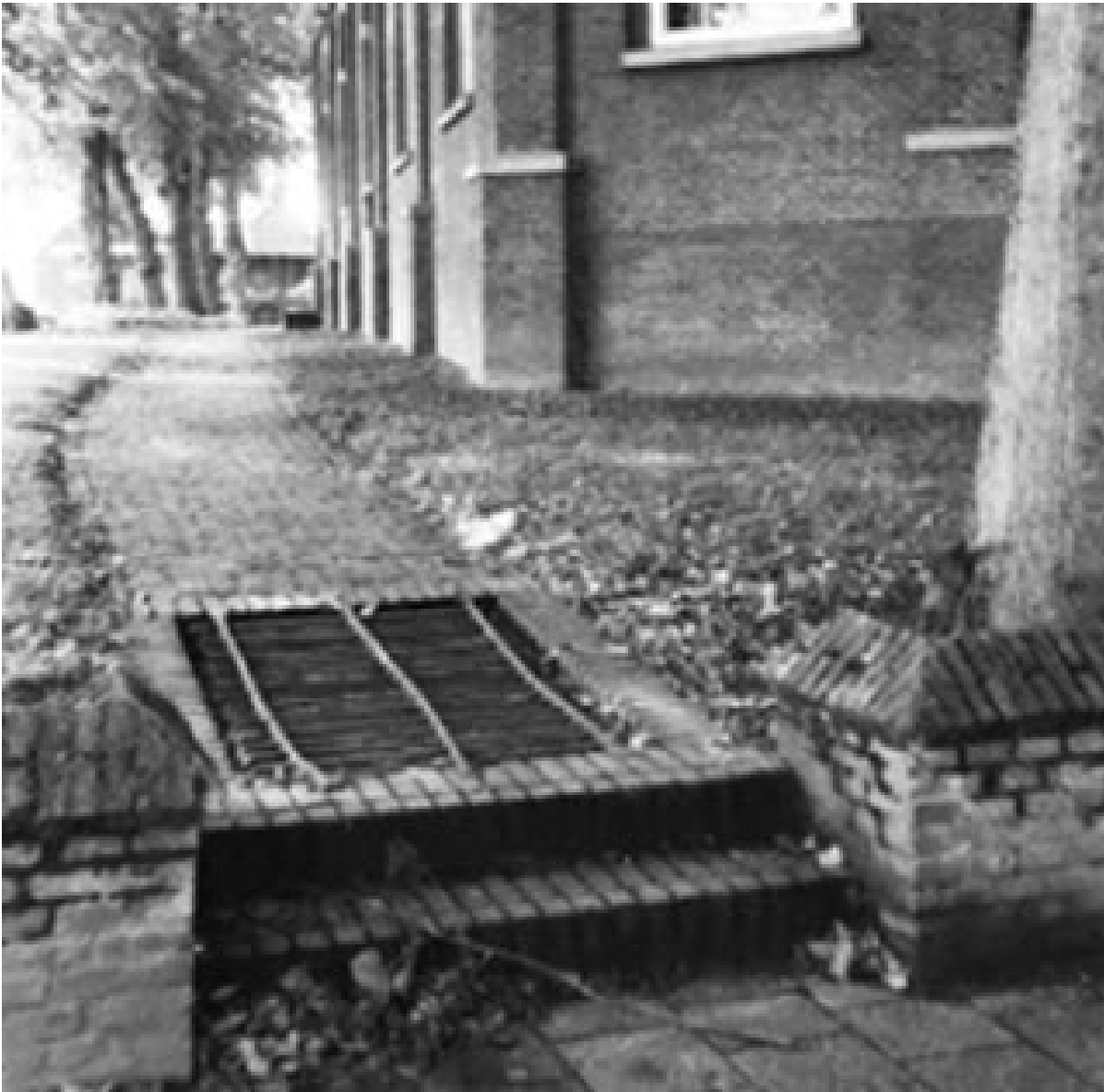
Het Borger “rooster” bij de ingang van het kerkhof

gebouw. Het rooster, dat het kerkerf scheidt van de Hoofdstraat, belette loslopende varkens het kerkhof te betreden. In de volksmond heette het, dat het rooster de duivel met zijn bokkepoten moest weren.