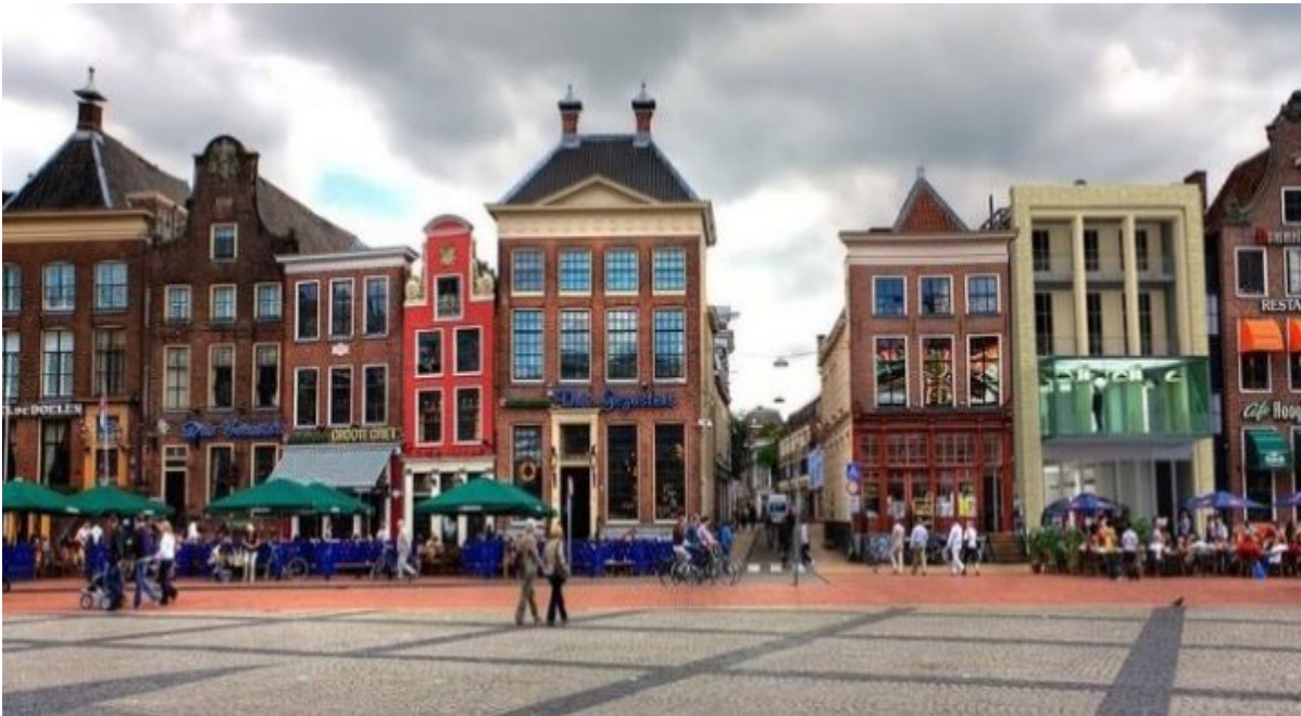
De Grote Markt van Groningen, startplaats van de route

De ligging van de stad is niet toevallig, want Groningen ligt op het meest noordelijke deel van de Hondsrug, op de overgang van zand naar klei en geflankeerd door moeilijk begaanbare hoogveenmoerassen. Dat betekende dat de bewoners relatief veilig waren voor zowel hoog water als indringers. Ook voor de handel was de ligging aan de overgang tussen klei en zand en nabij de Drentsche Aa bijzonder gunstig.