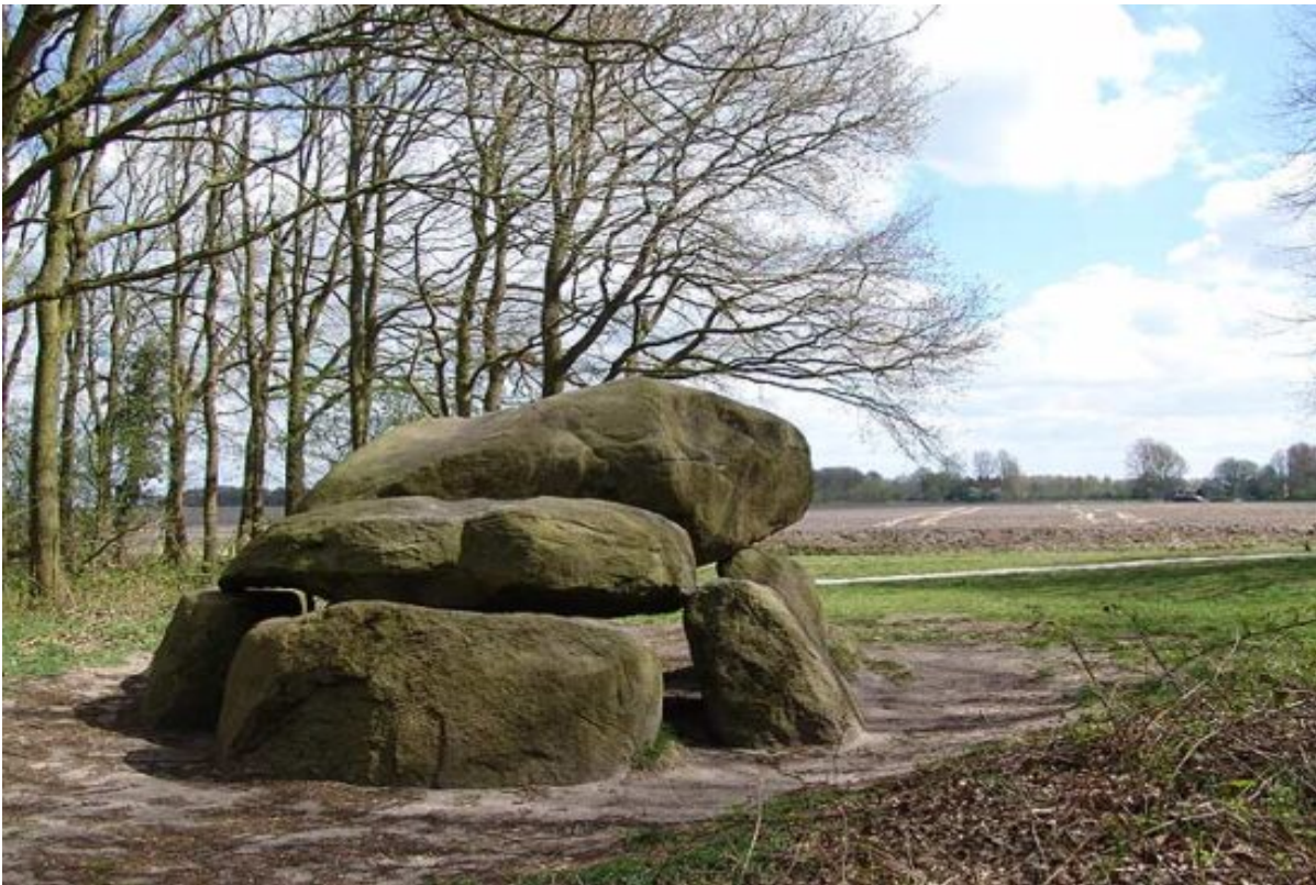
Hunebed G1 te Noordlaren

Hunebed 't Heiveen genoemd. De eerste vermelding van het hunebed dateert uit 1694.