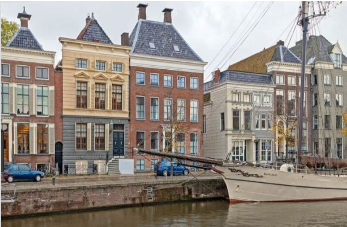
Herenhuizen aan de Hoge der A