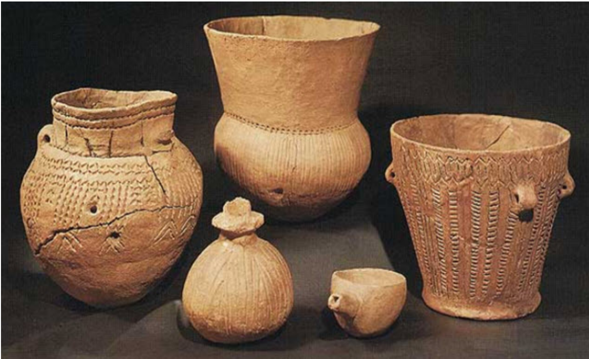
Een stel Trechterbekers

de Trechterbekercultuur. Dit akkercomplex stamt uit ongeveer 4.500 jaar voor het begin van onze jaartelling.