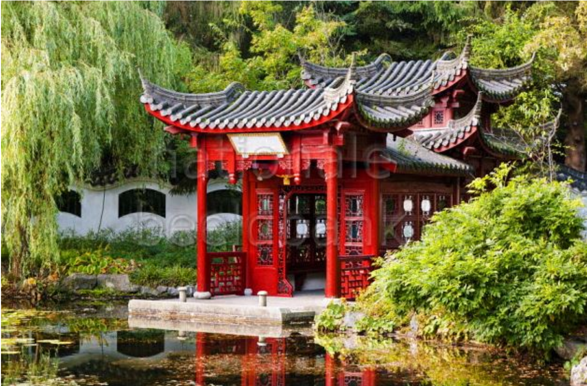
Chinees paviljoen in de Hortus